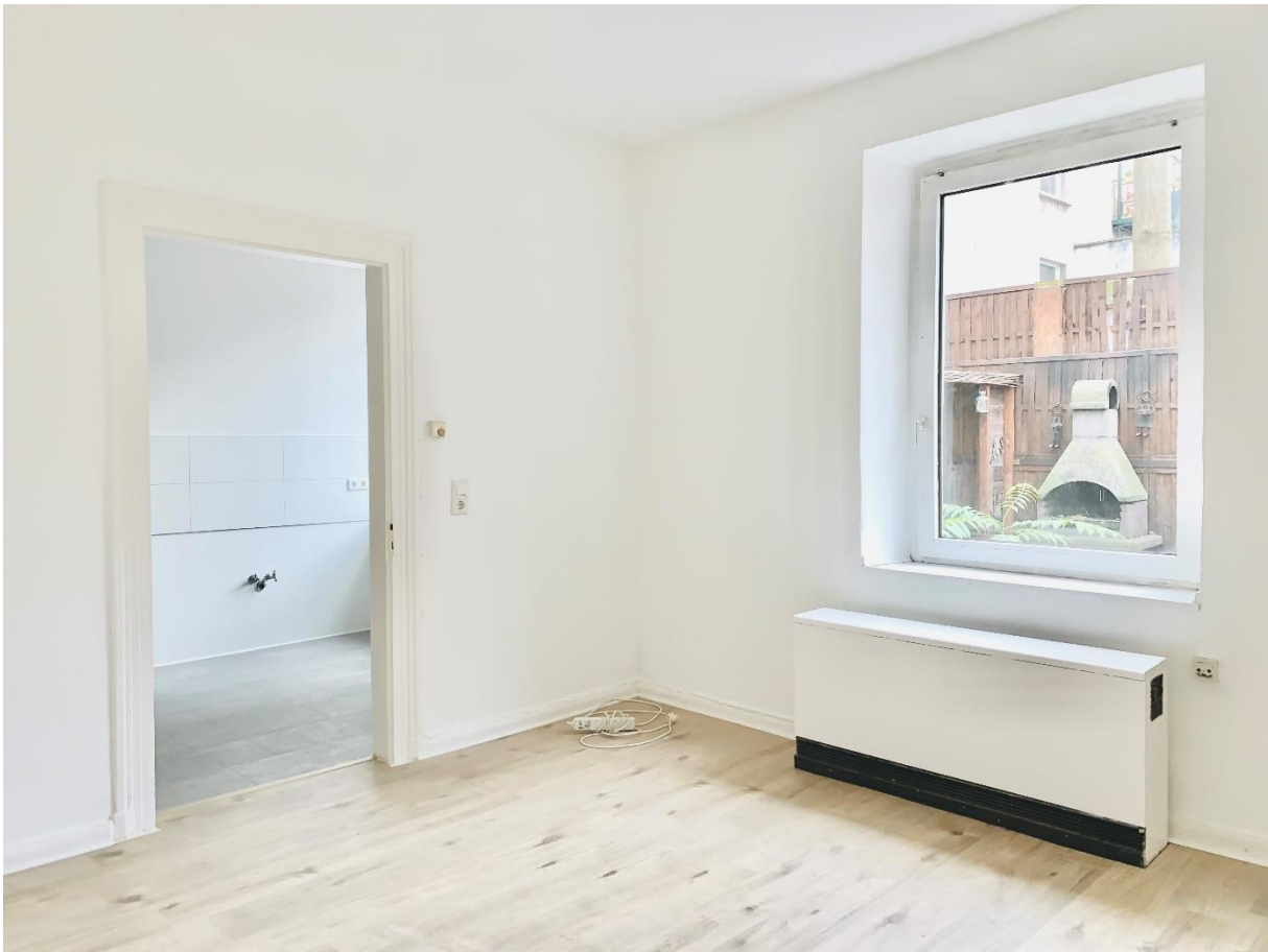
Sanierte 1-Zimmer Wohnung